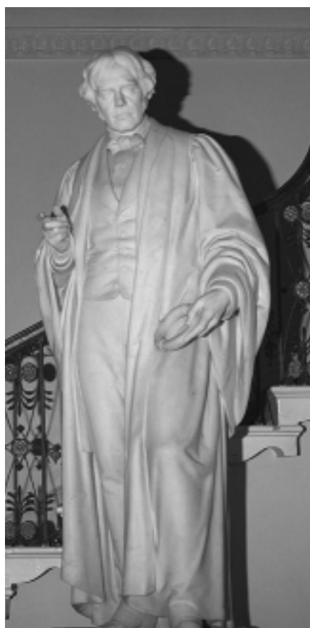
Michael Faraday (1791-1876) Londra, Royal Institution

moto la prima automobilina rende quest'ultima capace di metterne in moto un'altra. Accumulando esperimenti e osservazioni di questo genere si conclude che il lavoro compiuto contro le forze di inerzia non va perduto, anzi si conserva - almeno in prima approssimazione - restando per così dire immagazzinato nell'ultimo mobile che ha cambiato il suo stato. Dalla meccanica si sa anche che l'energia può essere di almeno due forme diverse, potenziale e cinetica, giacché un corpo può cambiare di stato o perché cambia la sua velocità o perché cambia la sua posizione rispetto ad altri corpi che su di esso esercitano delle attrazioni o repulsioni. Detto in altro modo: un corpo può essere in grado di effettuare lavoro in virtù del suo stato di moto - come nel caso della prima automobilina, oppure in virtù della posizione a cui è stato portato - come nel caso di un peso sollevato.