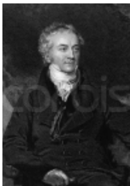
Thomas Young (1773-1829)

Conviene dunque riflettere un poco, cominciando dal principio. Il termine «energia» proviene dalla parola greca; ἐνέργεια ( enérgeia ), che nella filosofia di Aristotele significava qualcosa come «forza in azione», per opposizione alla parola δύναμις ( dynamis ), che indica la capacità pura e semplice di produrre un qualche effetto, - grosso modo, la forza cui si fa riferimento nell'espressione «essere forte». Questa differenza è importante. Aristotele la mise in luce con l'esempio di un istruttore e di un allievo. Un istruttore, diceva, modifica le capacità dell'allievo quando gli insegna a fare qualcosa. Tuttavia, fintanto che l'allievo non applica la sua conoscenza, essa rimane allo stato di δύναμις , di potenzialità, giacché egli è solo uno che sarebbe in grado di fare o di capire certe cose se ne capitasse l'occasione; se invece mette in opera le nuove conoscenze, la cosa è ben diversa, e questo metterle in opera, - continua Aristotele - è la corrispondente ἐνέργεια . Intorno al 1800 la parola fu introdotta in fisica da Thomas Young (1773-1829), noto per i suoi lavori sull'elasticità, e dopo un'elaborazione di oltre mezzo secolo la