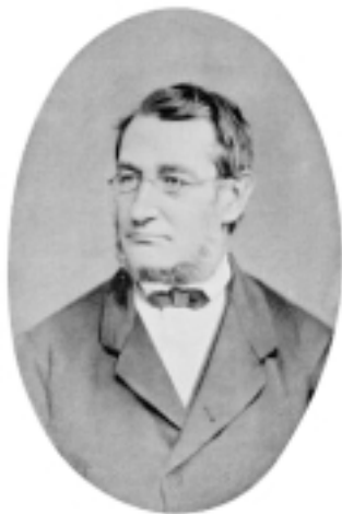
Julius Mayer (1814-1878)

Abbiamo così esaminato per l'essenziale cosa significa e cosa sottintende la definizione universalmente accettata dell'energia. Per completare il quadro vogliamo tornare su una questione affascinante: visto che è una grandezza così multiforme, non ha una relazione con il lavoro umano, in quanto «fatica», che non si limiti all'analogia con il freddo concetto di lavoro della meccanica? Curiosamente, sì. Quando Julius Mayer arrivò a chiarire definitivamente che il calore è una forma di energia, e quindi a enunciare la conservazione di quest'ultima, ciò avvenne davvero in relazione al lavoro umano; l'idea dell'equivalenza fra calore e lavoro gli venne, come racconta Wilhelm Ostwald, «quando ebbe a fare il salasso a parecchi marinai [nella rada di Surabaja, a 7 gradi di latitudine Sud], e trovò il sangue venoso